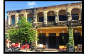
Romantische Restaurants in antiken Kolonialvillen

Nochmals verbringen wir einen ganzen Tag, damit du diese faszinierendste und altertümlichste Stadt Vietnams ausgiebig erkunden kannst. Wer möchte, kann auch Velo- und Bootstouren in die schöne Umgebung unternehmen oder am nur 4 Km entfernten Sandstrand schwimmen gehen.