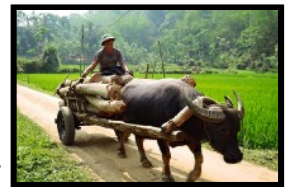
Dieses Transportmittel benötigt nur Gras und kein Benzin

Bei Sonnenaufgang erwachen wir mit den Alltagsgeräuschen des Dorfes. Nach dem Frühstück schnüren wir die Wanderschuhe, um 1.5 Stunden talwärts zu laufen. Unterwegs geniessen wir fantastische Ausblicke über gigantische Reisfelder und durchqueren die ausgeklügelten Bewässerungssysteme der Reisterrassen. Sie stellen eine bauliche Meisterleistung dar. Heute kreuzen sich unsere Wege erneut mit gutmütigen Wasserbüffeln, grunzenden Schweinen und lachenden Kindern. In der Talebene angekommen erwartet uns der lokale Guide mit einem Minibus. Nach kurzer Fahrt erreichen wir eine beliebten Ausflugsort für Einheimische. Es gibt hier heilige Fische in einem Quell-Bach und einen sehr interessanten lokalen Markt. An den vielen Strassenläden werden wir allerlei exotische Produkte erspähen und ausprobieren. Nach dem Mittagessen geht es wieder retour in Richtung Ninh Binh. Auf der Fahrt gibt es noch viele Möglichkeiten um das Alltagsleben der Vietnamesen zu beobachten. Den Abend verbringen wir dann im Homestay und haben noch genügend Zeit um das Nachtessen einzunehmen. Nach der Dämmerung gibt es eine einzigartige Möglichkeit, mit einem befreundeten Tourguide den riesigen Tempelkomplex bei Nacht zu besuchen - ohne Touristen und ohne all die riesigen Menschenschwärme - ganz privat und nur für Papillon Travellers! :-). Am späten Abend transferieren wir an den Bahnhof, wo wir auf den Nachtzug aufspringen und so in bequemen Schlafwagen weiter in Richtung Süden ziehen.