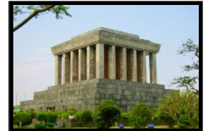
Kolossale Grabstätte vom Landesvater „Ho Chi Minh“