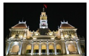
Prachtvoll beleuchtetes Rathaus