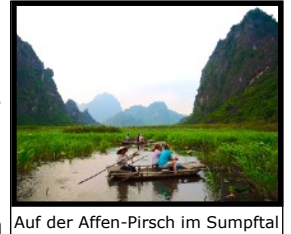
Auf der Affen-Pirsch im Sumpftal

Bambus-Boot ein anderes abgeschiedenes Tal, welches bis heute vom Tourismus verschont ist, und in das man nur auf dem Wasserweg gelangen kann. Durch gute lokale Kontakte ist es uns möglich mit unseren Reisegruppen diese einmalige Sumpflandschaft zu besuchen. Das kleine Tal ist das letzte Rückzugsgebiet auf der Erde, wo es noch eine kleine Population von 200 bedrohten „Delacour-Languren“ Affen gibt. Die Farbzeichnung des Fells ist sehr amüsant, weil es aussieht als ob die Affen eine weisse Unterhose tragen :-). Dieses Feuchtgebiet ist ausserdem auch die Heimat von vielen seltenen Vogelarten. Die Landschaft ist übersät mit Schilf und Wasserpflanzen. Die Schönheit und Ursprünglichkeit dieses märchenhaften Tals wird dich bestimmt verzaubern! Nach der Rückkehr in unsere Unterkunft, erhalten wir von unserer Gastfamilie ein leckeres vietnamesisches Nachtessen serviert.