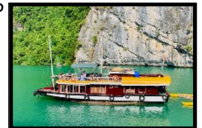
Unser Boot ankert in Buchten abseits der Touristenhorden

Am Morgen fahren wir mit einem Minibus an die Meeresküste. Der Transfer dauert 2.5 Std. Von dort aus steigen wir auf eine Fähre, die uns nach kurzer Fahrt auf eine Insel bringt. So gelingt es uns, die riesigen Touristen-Ströme der Halong Bucht zu umgehen. In einer kleinen Hafengebucht liegt unser privates Hotelschiff vor Anker. Wir gleiten durch einsame Buchten und Fjorde und bewundern die atemberaubende Gegend um uns herum. In einer seichten Bucht geniessen wir das feine Mittagessen an Bord unseres traditionellen Holzbootes. Nach einer kurzen "Siesta" geht es weiter durch ein Gebiet mit tausenden steil aus dem Wasser ragenden Karst-Inseln (ein Teil der Bucht ist UNESCO-Schutzgebiet). Wir besuchen einen unberührten Abschnitt der Halong Bucht, wo wir kaum andere Schiffe antreffen. Unterwegs sehen wir schwimmende Fischerdörfer und Perlenfarmen. Mit dem Kajak erkunden wir eine atemberaubende Lagune, welche nur durch einen Tunnel per Boot erreicht werden kann. Dank guten Kontakten zur Küstenpolizei sind wir die einzigen westlichen Leute, die diese unter Naturschutz stehende Lagune besuchen dürfen! Zum Schlafen stoppen wir in einer einsamen Bucht, wo nur unser Kapitän die Bewilligung zum Ankern hat. Wir übernachten in einfachen Bootskajüten oder, wer lieber möchte, auf dem Schiffsdeck unter dem strahlenden Sternenhimmel.