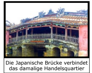
Die Japanische Brücke verbindet das damalige Handelsquartier