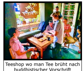
Teeshop wo man Tee brüht nach buddhistischer Vorschrift

Nach dem Frühstück unternehmen wir einen geführten Spaziergang durch die Altstadt mit einem lokalen Guide. Er kennt die entlegensten Winkel und führt uns durch schmale Gassen und zeigt uns wie die Einheimischen in den Hinterhöfen leben. Auf einer versteckten Dachterrasse hat ein streng Gläubiger Buddhist sein Teehaus eingerichtet. Hier zelebrieren wir die „wahre“ Kunst des Tee trinken nach buddhistischen Vorschriften. Der Inhaber ist ein absoluter „Tee Fanatiker“ und für das Teewasser verwendet er nur frisches Regenwasser. Auf dem heutigen Spaziergang quer durch die schmalen Gassen der Altstadt, sehen wir aus nächster Nähe das Handels & Geschäftsgebaren der Einheimischen. Am Nachmittag gibt der Reiseleiter Empfehlungen, wie du deine freie Zeit in der quirligen Hauptstadt gestalten kannst. Bummle durch die Altstadt mit ihren ehemaligen Handelsstrassen und Märkten und wage dich in die Gassen inmitten des emsigen Treiben der tüchtigen Vietnamesen. Verpasse es auch nicht, die prächtigen alten Kolonialbauten aus der Zeit des französischen Einflusses zu besichtigen. Der Reiseleiter hält eine grosse Auswahl von Aktivitäten bereit und kann dir bei der Organisation und Planung behilflich sein.