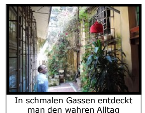
In schmalen Gassen entdeckt man den wahren Alltag