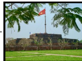
Der legendäre Flaggenturm der Kaiser-Zitadelle

Am Morgen erreichen wir die ehemalige Kaiserstadt und besprechen was diese geschichtsträchtige Stadt zu bieten hat und was du in deiner Freizeit alles anstellen kannst. In der Umgebung gibt es dutzende prunkvolle Kaisergräber zu besichtigen. Die Küche von Hue ist bekannt für die vielseitigen Gerichte und Spezialitäten der damaligen Kaiser. Die Köche mussten damals für die Kaiser permanent neue Gerichte erfinden und kreieren. Heute kannst du in einem der unzähligen Strassenrestaurants dinieren und die lokalen Köstlichkeiten probieren. Gemäss den Einheimischen ist die Küche von Hue die schmackhafteste des Landes.