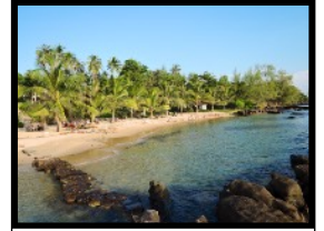
Unsere Privatbucht mit Strand