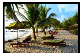
Entspannung und Erholung am malerischen Hotelstrand

Möchtest du noch einige Tage länger in „Phu Quoc“ verweilen? Natürlich gibt es unzählige Hotels in jeder Preisklasse. Falls du jedoch nicht das Hotel wechseln möchtest, kannst du mit unserem Partner-Reisebüro www.wisertravel.ch noch zusätzliche Übernachtungen in unserem Gruppenhotel buchen. (Siehe Infos unter REISE-FAKTEN VIETNAM "Zusätzliche Übernachtungen".)