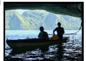
Mit dem Kajak in die Lagunen