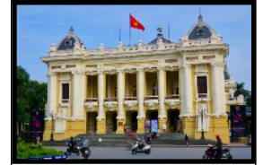
Fantastische Kolonialbauten sind Zeugen der damaligen Zeit

Einen ganzen Tag hast du Zeit, um die Hauptstadt zu erkunden und mehr über die Geschichte Vietnams zu lernen. Besuche einige der vielen Sehenswürdigkeiten und schlendere durch die Strassen des damaligen Indochina Reiches. Nachtschwärmer können Tanzen und Feiern in einem der vielen Bars und Clubs der Stadt. Geniesser trinken Kaffee & Cocktails am romantischen „Hoan Kiem“-See.