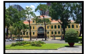
Das grösste Postgebäudes des Landes ist beeindruckend

Wir transferieren mit dem Minibus nach Danang und von dort geht es mit dem Flugzeug weiter nach Ho Chi Minh City, in die grösste Stadt des Landes. Unser Hotel liegt perfekt gelegen, um zu Fuss alle interessanten Stadtteile erkunden zu können. Nach dem Einchecken im Hotel unternehmen wir einen kurzen Erkundungs-Spaziergang durch die pulsierende Stadt, damit du dich besser orientieren kannst. Der Reiseleiter weist dich auf die wichtigsten Sehenswürdigkeiten hin und gibt Empfehlungen für die besten Bars und Clubs, die ein „verrücktes“ Nachtleben garantieren.