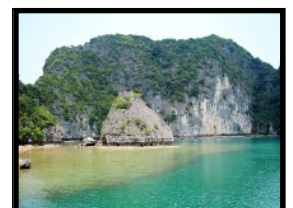
Schwimmen in Buchten und an einsamen Stränden

Den ganzen Morgen kreuzen wir durch dieses Inselparadies und geniessen die Ruhe und Einsamkeit auf unserem Schiff. Wir gleiten an wunderschönen Lagunen vorbei und bestaunen einsame Buchten, Lagunen und Strände. Unsere Route liegt abseits des Massentourismus und wir erkunden unberührte Gebiete. Wir tuckern durch ein malerisches Fischerdorf hindurch und gelangen dahinter in den kleinen Hafen. Hier verkosten wir ein leckeres Mahl, bevor wir dann am Nachmittag wieder auf den Bus steigen und retour auf das Festland gelangen. Nun kriegen wir wieder festen Boden unter die Füße und fahren mit dem Minibus weiter Richtung Süden nach Ninh Binh. Wir übernachten in einem schönen Homestay, welches liebevoll von einer lokalen Familie geführt wird. Das Abendessen hier ist ein Gaumenschmaus!