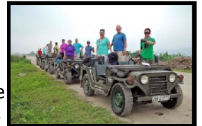
Unterwegs in unwegsamem Gelände mit Armee-Jeeps