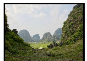
Wanderung durch verwunschene Karstlandschaften & Täler

Erst vor kurzer Zeit wurde diese Gegend ins Unesco-Weltkultur Erbe aufgenommen und deshalb nimmt der Massentourismus leider stetig zu. Doch wir entfliehen dem ganzen Rummel und erkunden die umliegende Gegend mit duzenden versteckten Tälern, malerischen Weihern, Fischfarmen und Reisfeldern. Um diese atemberaubende Karstlandschaft zu erkunden, machen wir ein Kombinations-Tour mit Minibus, Fahrrad & Spazieren. An einem Weiher steigen wir auf kleine Ruderboote und nach 15 Min. Fahrt gelangen wir zu einer Felswand, die im inneren eine Wasserhöhle verbirgt. Nach einem kurzen Marsch in der Höhle, gelangen wir an einen unterirdischen Fluss. Erneut steigen wir auf Boote und gleiten noch tiefer in die Höhle hinein und bestaunen die bizarren Tropfstein-Formationen. Zum Mittagessen lädt uns der lokale Guide in sein Haus ein, wo wir eine typische lokale „Hotpot“-Mahlzeit serviert bekommen. Am Nachmittag erforschen wir per