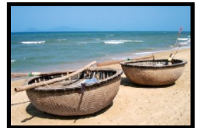
Traditionell geflochtene Korb-Fischerboote

Die Insel steht erst am Anfang, um sich dem Tourismus zu öffnen. Seine Inselbewohner pflegen noch immer dieselben Traditionen wie seit Jahrhunderten. Im nördlichen Teil gibt es absolut unberührte Urwälder, die unzählige bedrohte Pflanzen, Bäume und Tierarten beheimaten. Die Fischerdörfer hier zählen zu den schönsten und buntesten in ganz Asien. Ausserdem ist die Insel weit über die Landesgrenzen bekannt für den hervorragenden Pfeffer, der hier wächst, und die Herstellung einer der weltbesten Fischsaucen. Dein Reiseleiter gibt dir Tipps, wie du deine Freizeit auf der Insel gestalten kannst. Wir geniessen ein letztes gemeinsames Abendessen bevor wir uns voneinander verabschieden müssen.