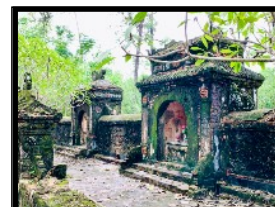
Ein sehr seltener Tempel ist den toten Eunuchen gewidmet