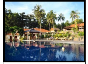
Das grosszügige Resort ist eine wahre Oase der Ruhe

Vom Flughafen in Cantho fliegen wir 45 Minuten um die Insel Phu Quoc zu erreichen. Nach der Landung am Flughafen fahren wir direkt zu unserer idyllischen Bungalowanlage mit einem privatem kleinen Sandstrand. Unser Resort liegt abseits des Massentourismus und die ganze Anlage ist harmonisch in die umliegende Natur eingebettet. Ein perfekter Ort, um die vielen Erlebnisse und Abenteuer der letzten Wochen zu verdauen. Man kann am Infinity Pool oder Sandstrand schwimmen und faulenzen oder sich mit professionellen Massagen so richtig verwöhnen lassen. Am Abend schlürft man feine Cocktails, genießt lokales Essen und bewundert die spektakulärsten Sonnenuntergänge von ganz Vietnam.