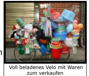
Voll beladenes Velo mit Waren zum verkaufen

Die Anreise nach Vietnam erfolgt individuell. Unsere Reisegruppe trifft sich in einem schönen Hotel in der Altstadt von Hanoi. Am Abend lernst du die anderen Gruppenteilnehmer kennen. Beim Willkommen-Meeting erhältst du letzte wertvolle Tipps zur bevorstehenden Reise. Unser gemeinsames Abenteuer beginnt mit einem Spaziergang durch die pulsierende Altstadt. Der Reiseleiter gibt nützliche Empfehlungen zur Verhaltensweise in Vietnam. Das erste Nachtessen genießen wir in einem traditionellen vietnamesischen Restaurant. Wer danach noch Lust hat, ein lokales „Bia Hoi“ an der Strassenecke zu trinken, ist herzlich willkommen.