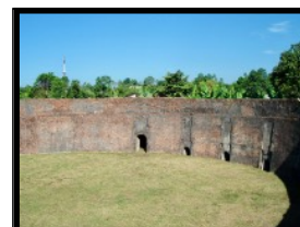
Weltweit einzigartig ist die Tiger/ Elefanten Kampf-Arena

Mit einheimischen Mofa-Fahrern unternehmen wir eine ganztägige Tour in die Umgebung. Du sitzt auf dem Rücksitz des Töffs, und so erkunden wir all die wunderschönen Orte, die man nicht mit dem Bus erreichen kann. In einer Kung-Fu Schule erhalten wir eine eindrucksvolle Demonstration, präsentiert von den besten Kung-Fu Schülern des Landes. Der Lehrer dieser Schule ist ein Nachfolger der Elite-Mandarin-Kämpfer, die damals den Kaiser beschützen mussten. Heute fahren wir kreuz und quer durch schmale Gassen und entdecken ursprüngliche Dörfer, ehemalige Kriegsschauplätze, majestätische alte Kaisergräber und ein antikes Colosseum, in welchem Tiger und Elefanten kämpften. Wir sehen, wie konische Hüte und Räucherstäbchen in lokalen Handwerksbetrieben hergestellt werden. Am heutigen Tag erfährst du sehr viel Interessantes über die Geschichte und erlebst hautnah die wahren lokalen Lebensgewohnheiten der Vietnamesen abseits der üblichen Touristenrouten!