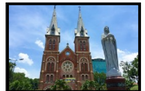
Die alte französische Kirche ist ein beliebtes Fotomotiv

Wir verbringen einen vollen freien Tag, um die grösste Stadt des Landes zu erkunden. Amüsiere dich ab dem Chaos, wenn tausende Motorräder durch die Strassen brausen. Am Abend lässt es sich herrlich durch die quirligen Strassen und Parks bummeln. Überall gibt es gemütliche Restaurants, Bars und Cafés. Das Herz der Shopping-Fans schlägt höher bei einem Besuch der zahlreichen Märkte. Hier gibt es tolle Souvenirs für wenig Geld zu erhandeln. Nach dem Nachtessen kann man einen Cocktail schlürfen auf der gleichen Hotelterrasse, wo damals die US-Kriegsgeneräle ihre geheimen Taktiken besprachen.