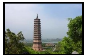
Schöne Aussicht auf die höchste Pagode von Vietnam